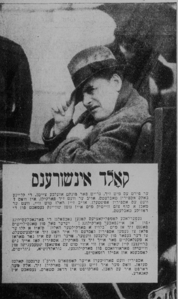
קאלר אינשורענס דאס איז דער ערשטער פון זיין סארט אין דער וועלט. ער האט אן אייגענעם פלאן פאר דעם אינשורענס. דאס איז דער ערשטער פון זיין סארט אין דער וועלט. ער האט אן אייגענעם פלאן פאר דעם אינשורענס.