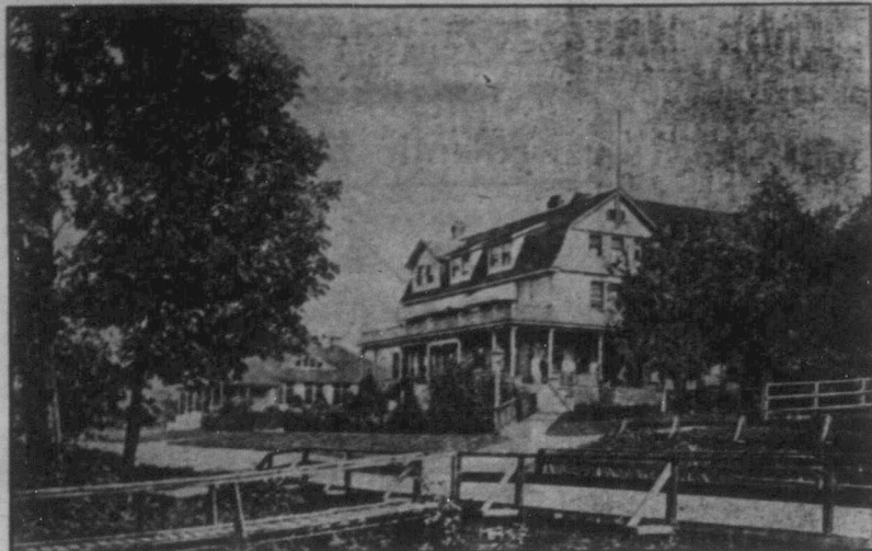
NORTH VANCOUVER HOTELL, NORTH VANCOUVER, B. C.

Rekommenderas i landsmännens benägna åtanke