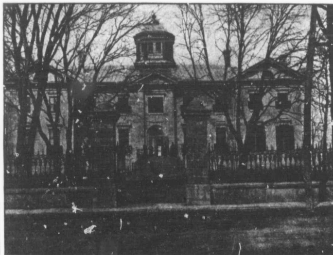
Juvénat de Terrebonne.

Le 26 janvier dernier, jour de notre fête patronale, (du Juvénat.) St Tharsicius, Montréal nous a délégué 3 futurs Novices, élèves de Rhétorique, "plantes un instant exportées de la serre chaude de notre Maison d'adoration, pour revenir vers la pépinière où elles avaient germé et grandi .. " Ils étaient heureux de revoir le nid où naquirent leurs ailes... et exciter par leur exemple leurs petits frères à prendre leur essor vers le Noviciat.