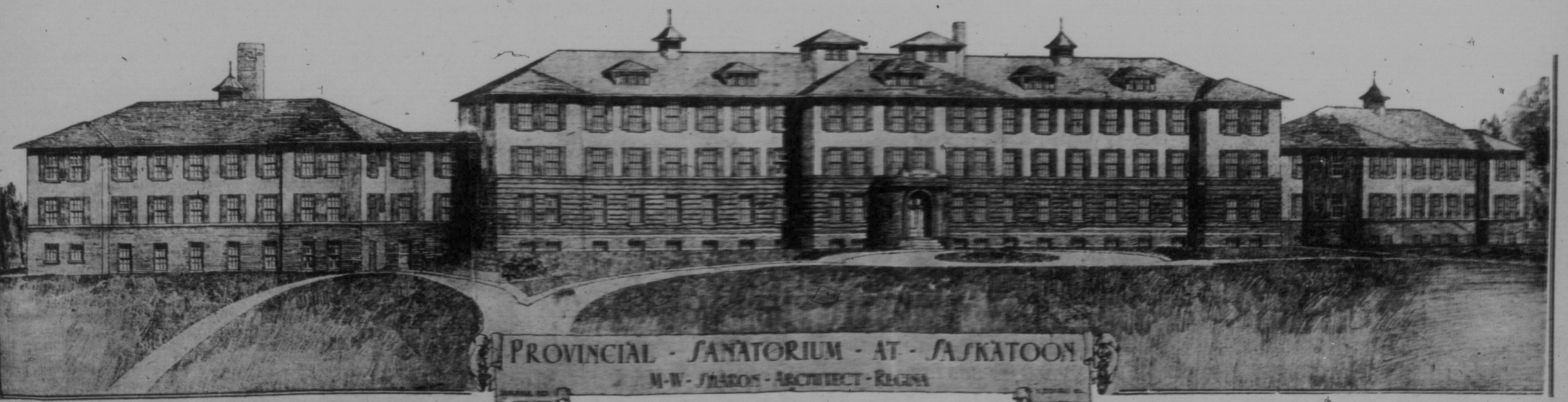
PROVINCIAL SANATORIUM - AT - SASKATOON M-W-JARON - ARCHITECT - REGINA

Konstantinopel, 16. Sept. — Britische Truppen marschieren durch Surien, um König Hussein beizustehen, der in einem Kampf in Arabien durch den Entzug von Arabern besiegte wurde. Surien steht zwar unter französischer Mandat, aber den englischen Truppenbewegungen werden keine Hindernisse in den Weg gelegt.