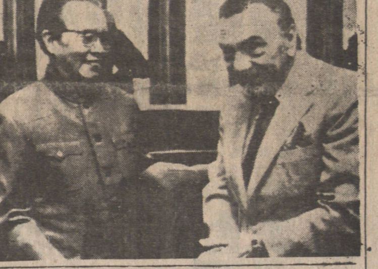
加將派貿易團訪華

(渥太華電) 加拿大人權委員會提出一項新政策，禁止聯邦政府大專部門對外透露公務員之人事資料，包括健康狀況、婚姻年齡出生日期地點等。在內，亦禁止人事資料，須在僱用之後方准查閱。又稱，人事部門不得查詢與工作無關之問題，包括身高體重、髮色眼瞳、軍隊服役紀錄與英文程度等等。