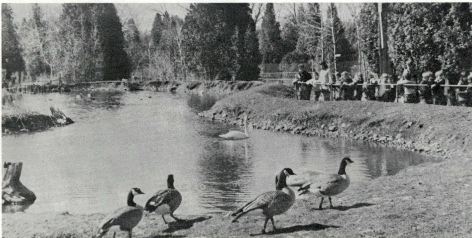
Le parc de gibier d'eau de Kortright qui s'étend sur 100 acres dans la périphérie de Guelph a été ouvert au public en 1967 et attire chaque année des milliers de visiteurs.

Le but du parc est d'inciter le public à s'intéresser et à appuyer l'aménagement et la conservation du gibier d'eau grâce à l'exposition permanente de cette faune sauvage. Il vise à sauvegarder pour les générations actuelles et futures le patrimoine que représentent le vol incliné des canards sauvages se dirigeant vers le marais par un crépuscule d'été, celui des oies migratrices, tableau de la vie même, entrevu dans un ciel de printemps, ou le chant merveilleux des cygnes traversant la brume d'un soir d'automne.