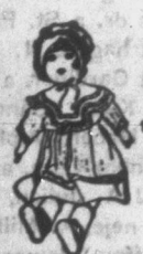
NYOLC teljes sorozat kártyáért