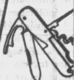
KÉT teljes sorozat kártyáért