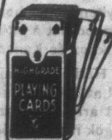
EGY teljes sorozat kártyáért

MAGYARORSZÁGBA ROMÁNIÁBA CSEHSZLOVÁKIÁBA, JUGOSZLÁVIÁBA ÉS AUSZTRIÁBA