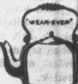
TIZ teljes sorozat kártyáért