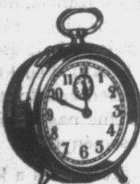
ÖT teljes sorozat kártyáért