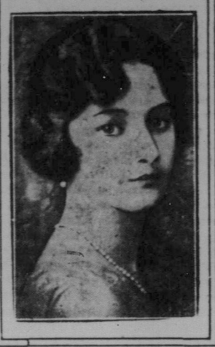
Dej unga hertigparet av Brabant.