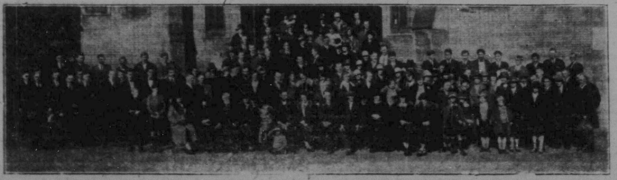
En del av festdeltagarna samlade utanför Svenska lutherska kyrkan.