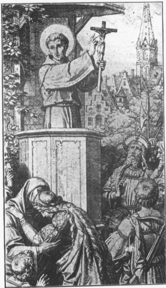
SAINT JACQUES DE LA MARCHE