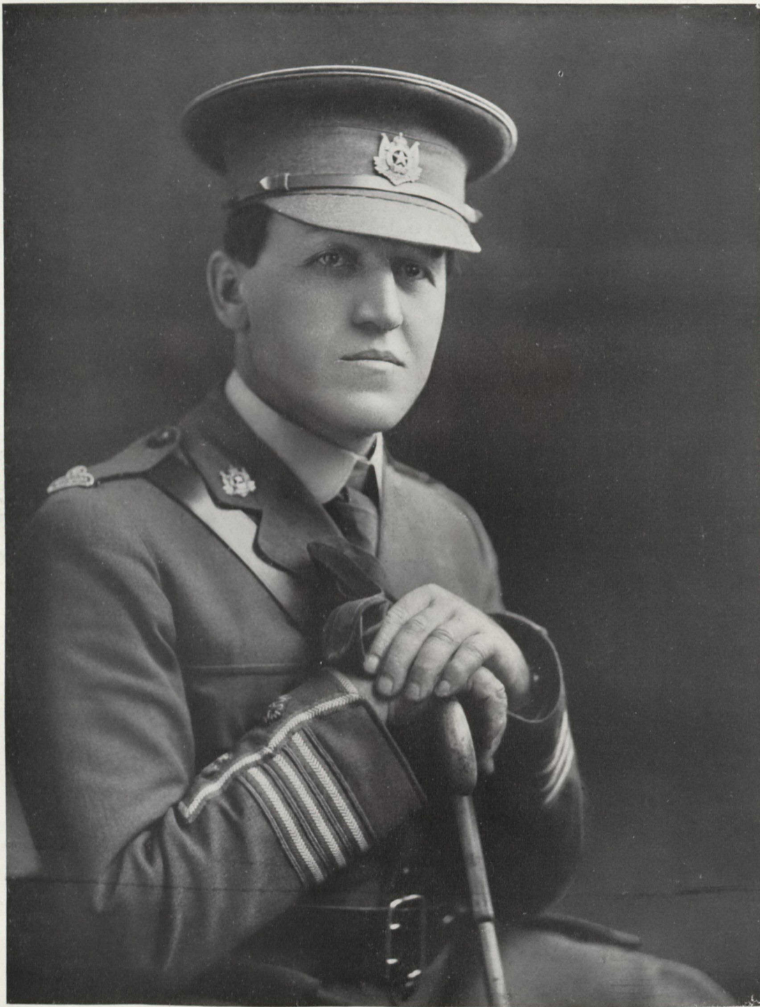
Lieutenant-Colonel Louis Cyriaque D'Aigle Commandant.