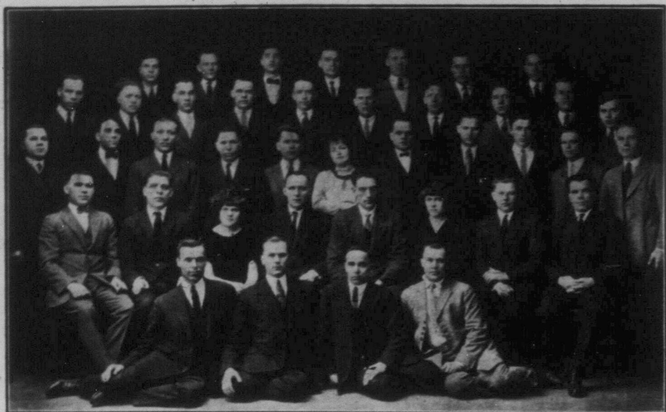
КУРСАНТИ І УЧИТЕЛІ ВИЩОГО ОСВІТНЬОГО КУРСУ ТУРФДІМ, що відбуваються в Вініпегу від 1. листопада 1925 р. до 30. квітня 1926 р. (шість місяців). Перед відходом з Вініпегу хор курсантів співає в комеді-оперетці "Майська Ніч", в суботу, 1. травня, на сцені Укр. Роб. Дому, а в неділю, 2. травня, дає величавий концерт, участь в якому візьмуть самі лише курсанти.

ВІДБУДУТЬСЯ В УКРАЇНСЬКОМУ РОБІТНИЧОМУ ДОМІ В СУБОТУ, 1. ТРАВНЯ ВЕЧЕРОМ ВІСТАВОЮ КОМЕДИ-ОПЕРЕТКИ "МАЙСЬКА НІЧ" І В НЕДІЛЮ, 2. ТРАВНЯ ВЕЧЕРОМ ВЕЛИЧАВІМ КОНЦЕРТОМ. УКРАЇНСЬКЕ РОБІТНИЦТВО ВІННІПЕГУ ПОВИННО ПРИБУТИ ГРОМАДНО НА ЦІ ВИСТАВИ.