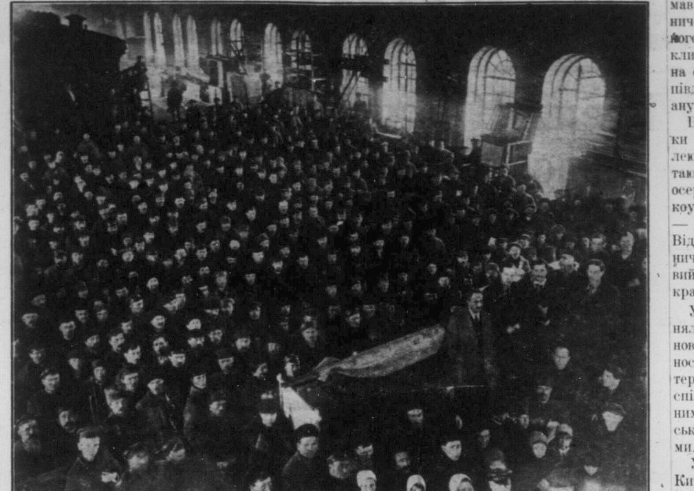
Робітники залізничних вагонних майстерень в Катєринославі, на Україні, зїбрались для перевиборів своїх представників в Міську Раду.

Уперше робітничая класа в Китаї дала поразку престижу англійського імперіялізму. Уперше моряки південного Китаю, що говорять особливю мовою, викликали організоване до себе співчуття моряків, залізничників, текстільників та інших робітників середнього та північного Китаю. Можна сказати, що боротьба гонконзьких моряків на початку 1922 року визнала ариєст класової самодїальності промислового пролетаріату в Китаї. Цей страйк назавжди поховав цілу низку забобонів, що жили до того часу серед класового робітничого та національно-визвольного руху в Китаї. Традиційній пролетаріату та цеховщини, що довго стояли на заваді вивідженню класового характеру боротьби китайського робітничого та національно-визвольного руху в Китаї, та доводилося на заваді вивідженню класового характеру боротьби китайського робітничого та національно-визвольного руху в Китаї, та доводилося на заваді вивідженню класового характеру боротьби китайського робітничого та національно-визвольного руху в Китаї.