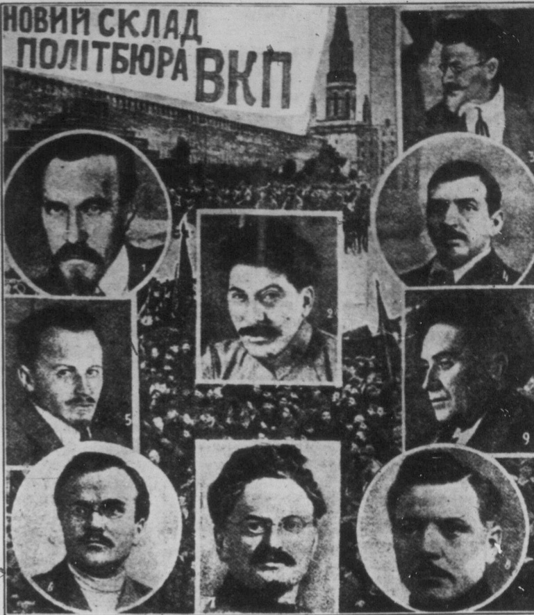
1) т. Ріков, 2) т. Сталін, 3) т. Калінін, 4) т. Томський, 5) т. Бухарін, 6) т. Молотов, 7) т. Троцький, 8) т. Ворошилов, 9) т. Зіновєв.

Геть наймитів, соціал-зрадників! Робітникам Англії, що підіймають боротьбу за єдність світового робітничого руху разом з робітничим класом Радянського Союзу — наше привітання.