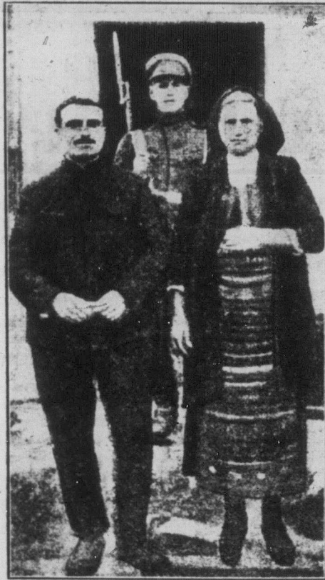
Болгарський селянин з жіною у ваській торії. Обидвоє вони застріляні на смерть за те, що належали до класової робітничо-селянської організації.

Вістка про міданську різню зі швидкістю блискавки поширилась по цілому Дамаску. Серед усього арабського населення скінчилося велике обурення. Сильному загоні танків та літаків (французьких) ледве ледве пощастило запобігти вибухові народнього гніву. Французький командант обіцявся покарати винних. Задля цього він звільнив 12 Черкесів з французької служби. Але більше він не міг зробити, бо Черкеси звертали на виразний дозвіл з боку французьких офіцерів, що дали їм грабувати й розбищувати.