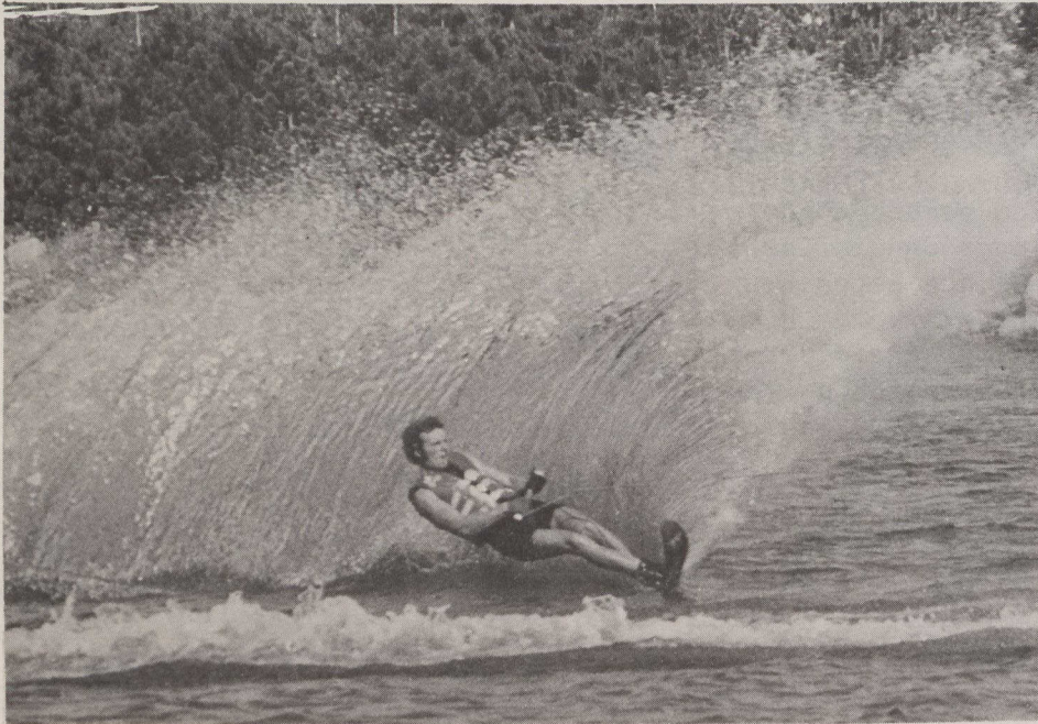
George Athans, campeón mundial de esquí acuático

Athans, campeón canadiense desde 1968, ganó su primer título mundial en España en 1971. Desde 1966, ha formado parte del equipo nacional de Canadá. En Bogotá,