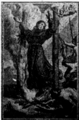
BX JEAN FOREST martyr franciscain, (fête, le 22 mai)