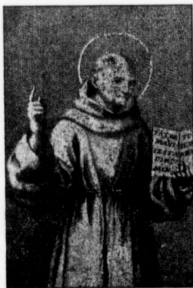
SAINT BERNADIN DE SIENNE (fête, le 20 mai)