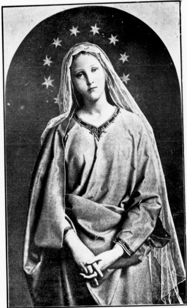
LA REINE DE MAI