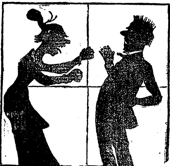
On s'fait d'la bile!!