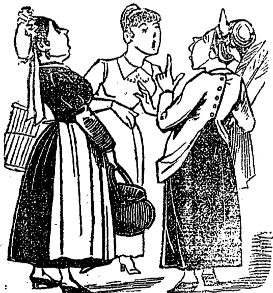
Nous nous faisons des illusions!!!