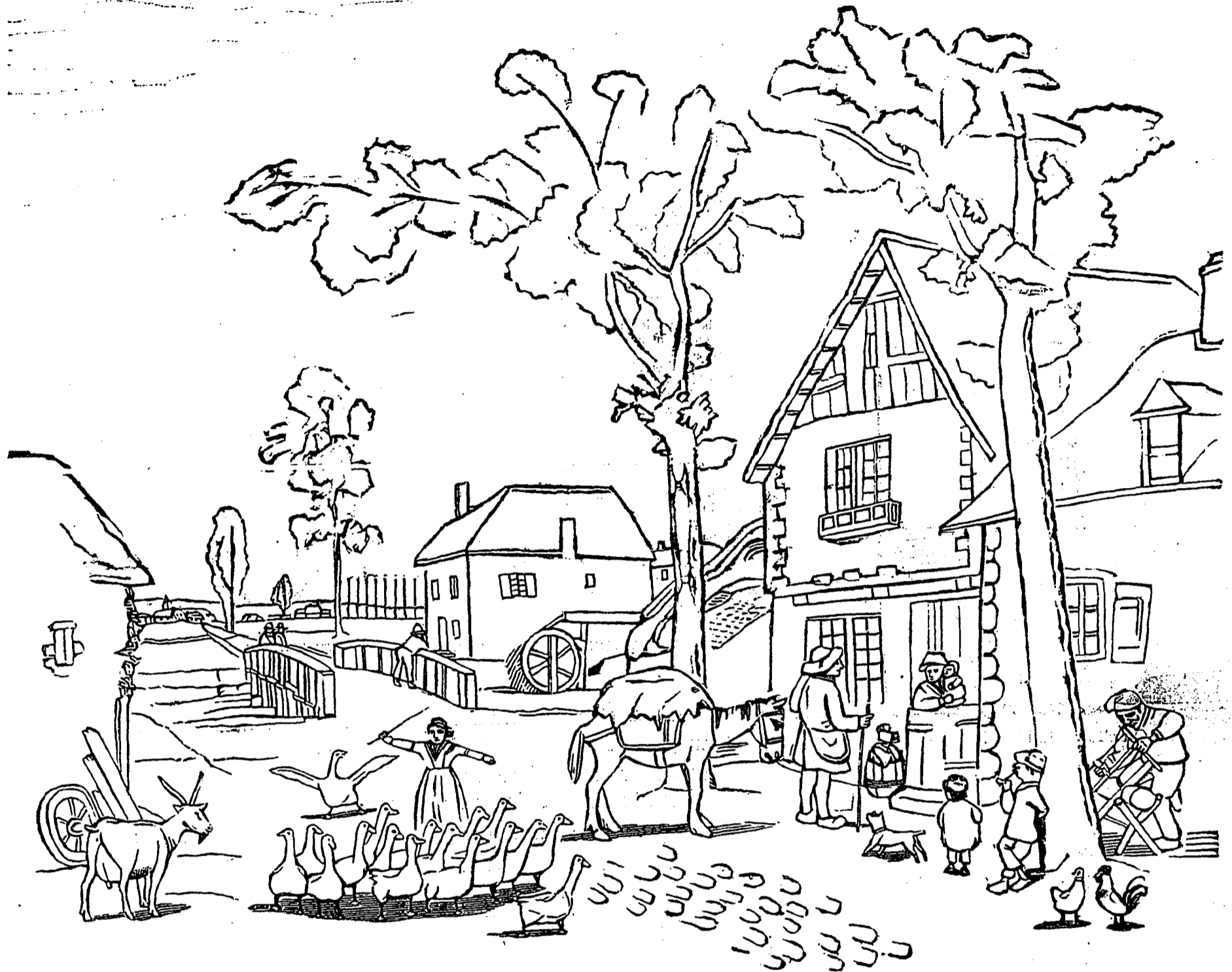
On se prépare pour l'arrivée des militaires.