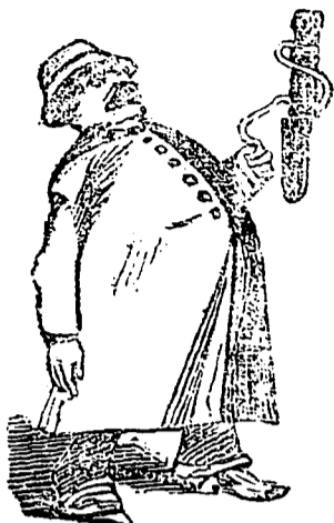
Je fais du lard!