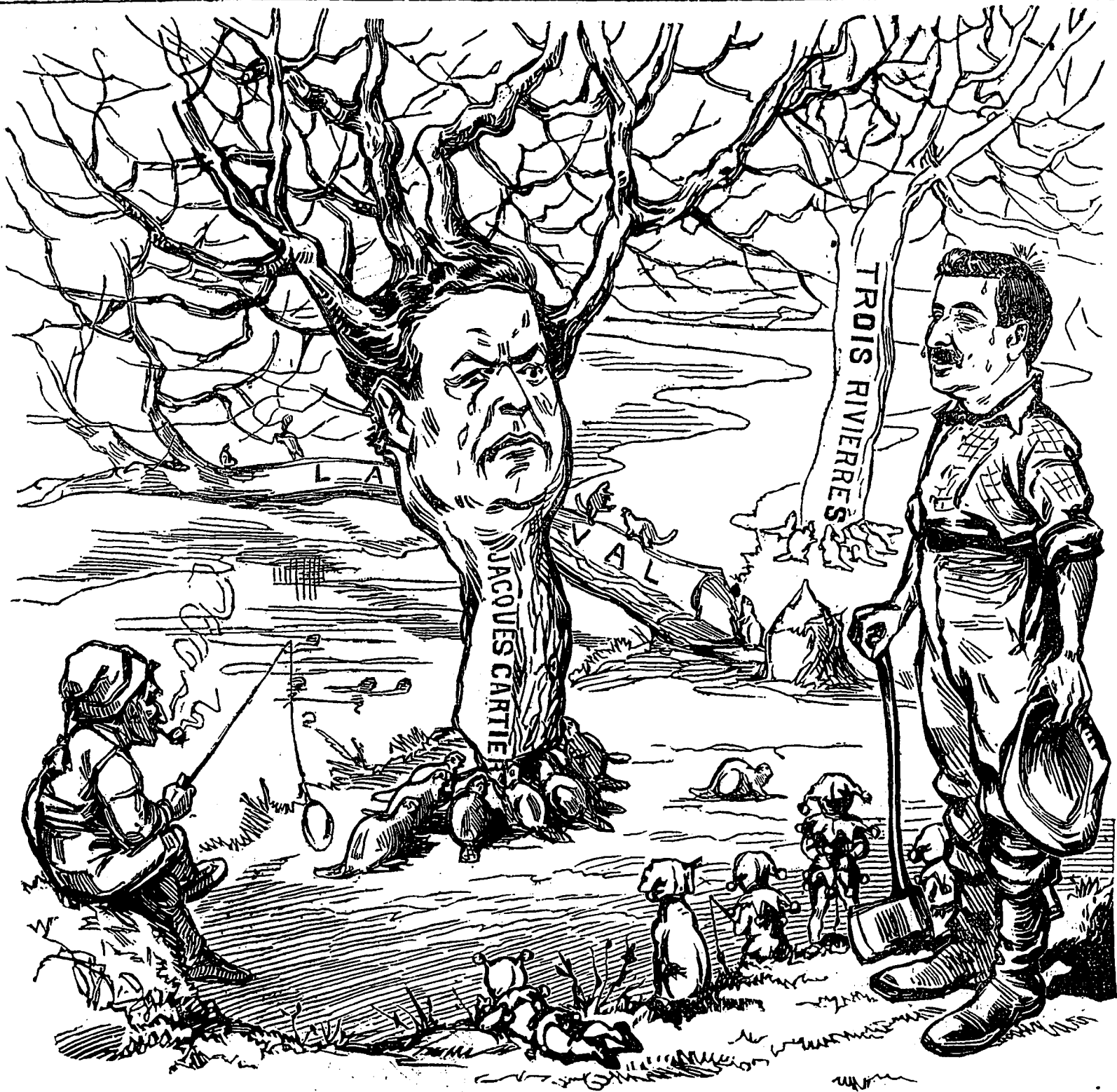
LE CASTOR EST UN ANIMAL RONGEUR. (Buffon)

M. MEACIER : On disait qu'ils ont mal aux dents... On a fait un mensonge énorme. Oh ! comme ils n'ont pas pris de temps, Pour couper le tronc... de cet orme ! Et du train qu'ils vont à la tâche, Trois-Rivières, Jacques-Cartier, Verront tomber leur front allier, Sans que je donne un coup de hache.