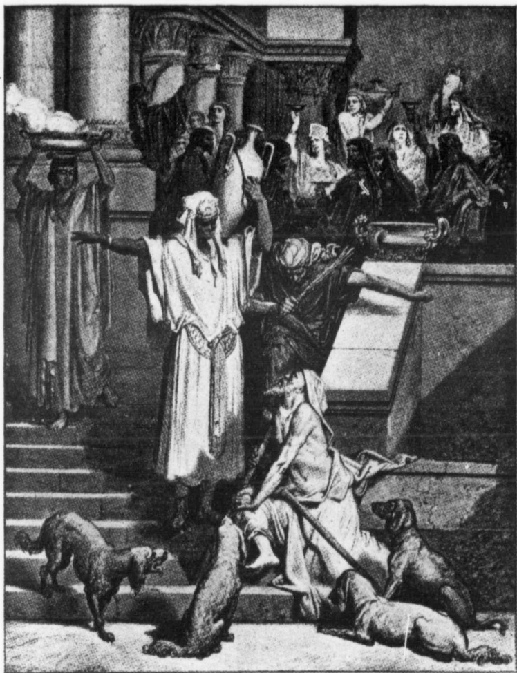
LAZARE A LA PORTE DU RICHE