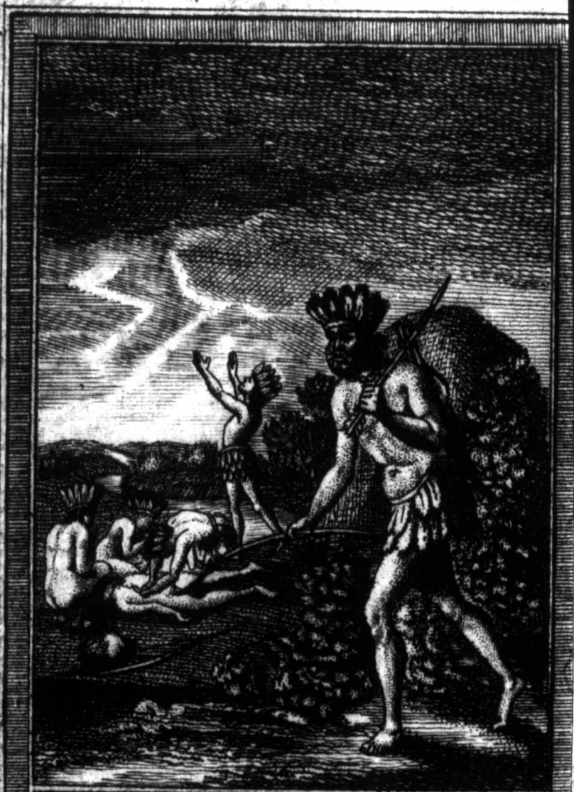
Etat du premier Chasseur et Guerrier. State of Hunting and War.