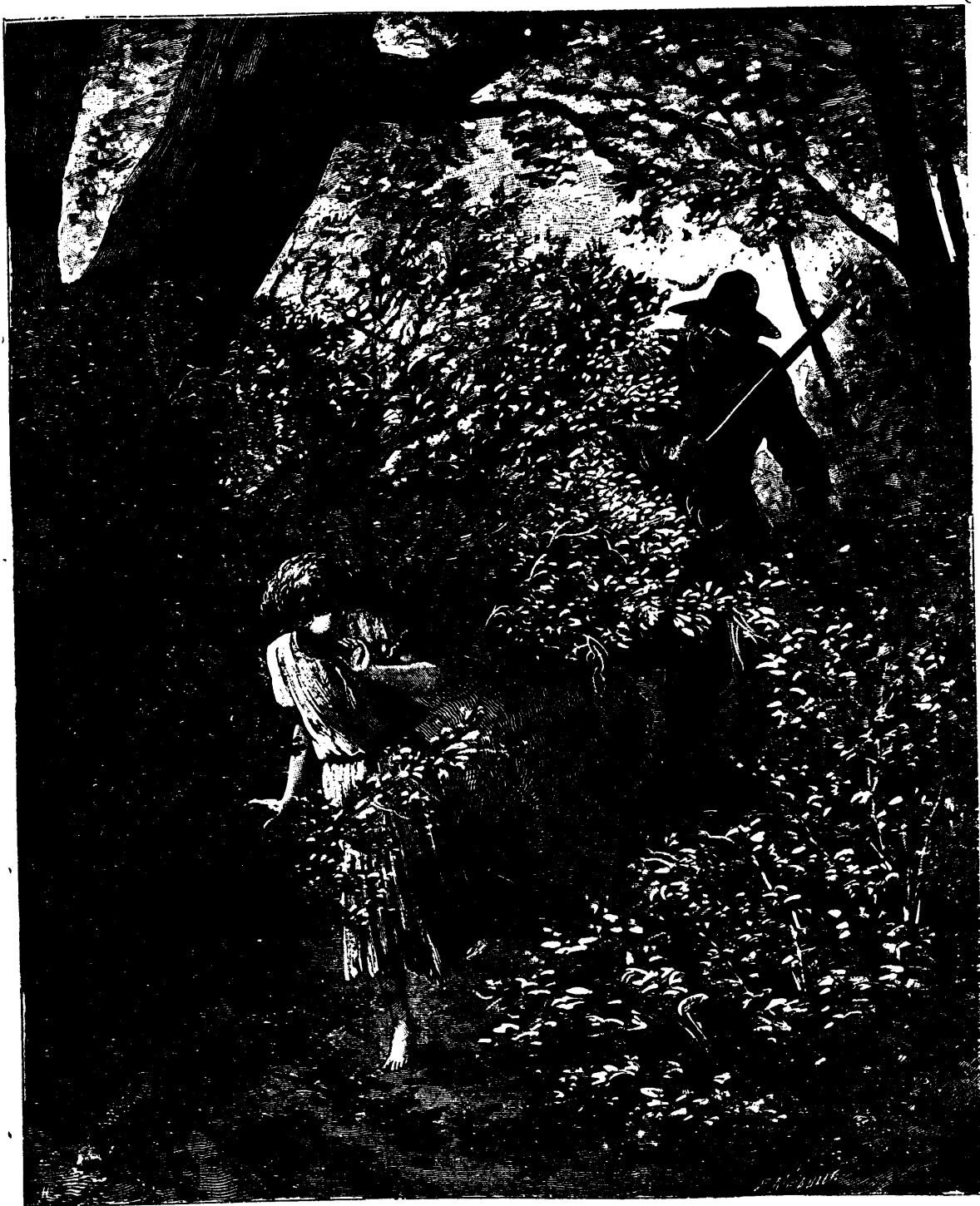
Elle se tint sur ses gardes, et, légère comme un chevreuil, elle se mit hors de son atteinte.—Voir page 422, col 1.