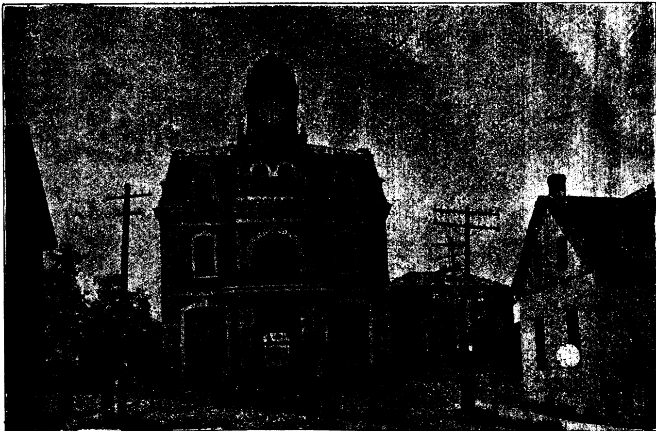
L'HOTEL-DE-VILLE ET LA PLACE DU MARCHÉ A TRAVERS LE CANADA. — SALABERRY DE VALLEYFIELD Photographies James Martin, Valleyfield. — Photo-gravures Armstrong