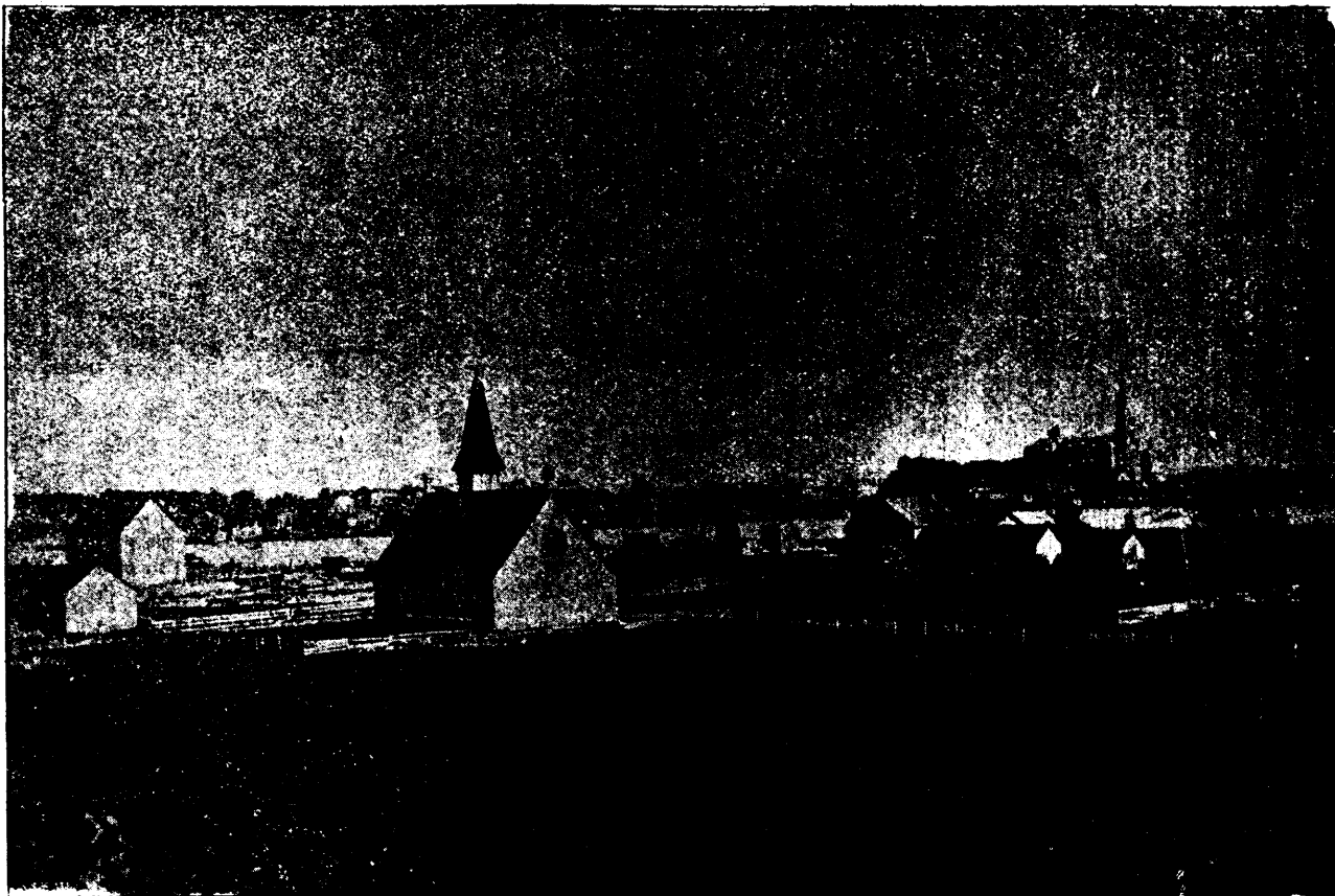
SALABERRY DE VALLEYFIELD A VOL D'OISEAU