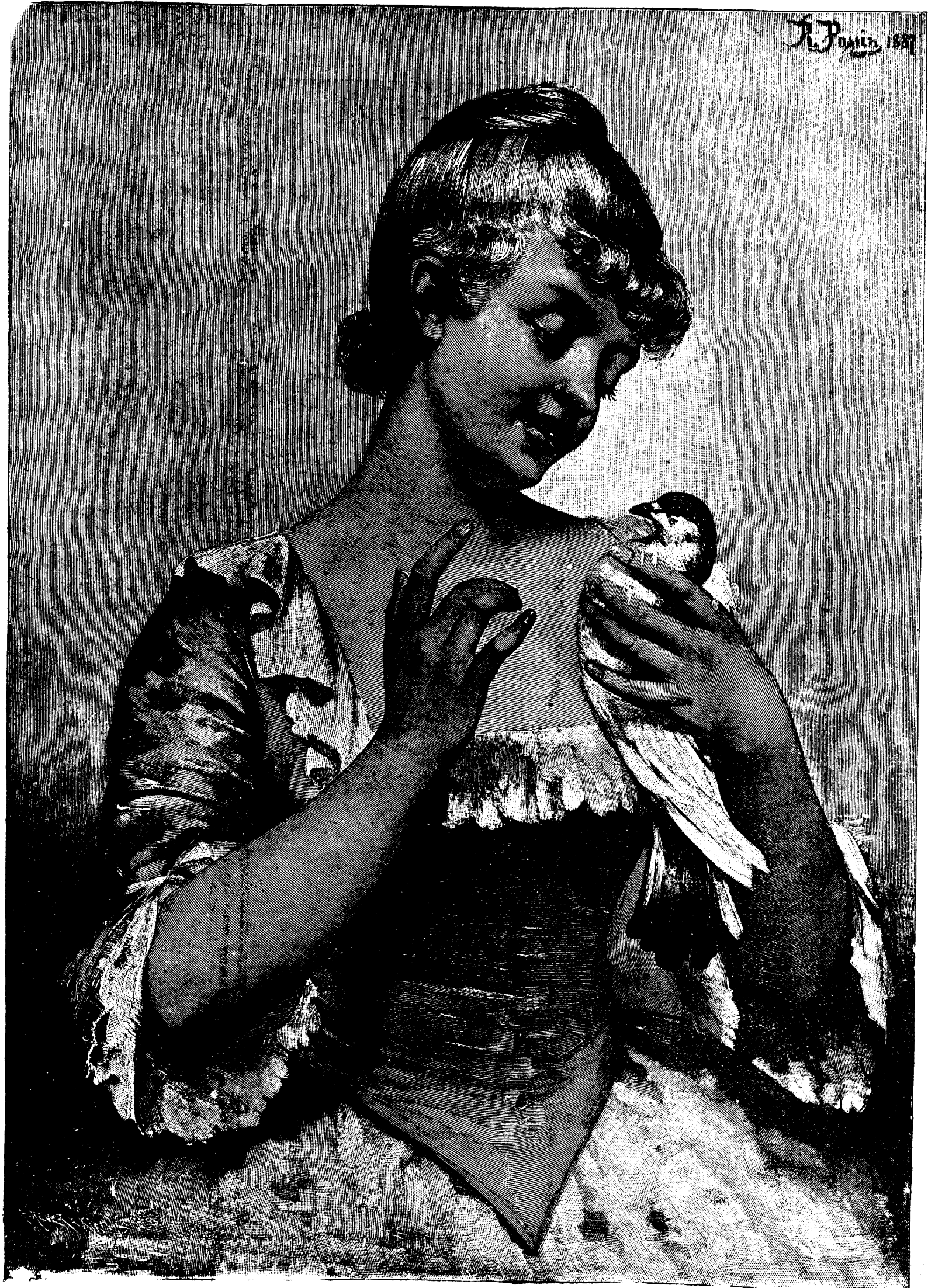
BEAUX-ARIS. — LE RETOUR DU FIDELE MESSAGER