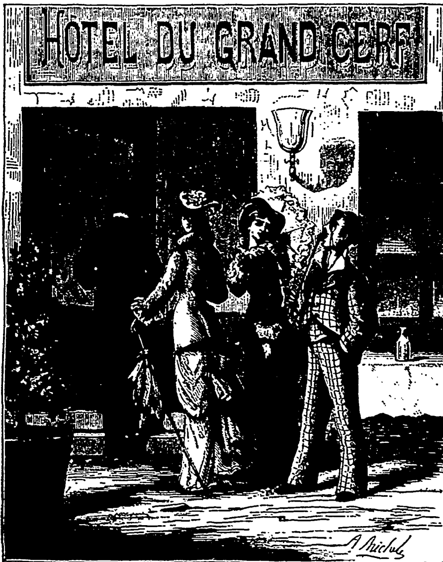
Fabrice entra dans l'hôtel, où le petit baron et les deux femmes le suivirent.

Madame Loriol leva les mains au-dessus de sa tête comme pour prendre le ciel à témoin de sa détresse, et se composa une physionomie désolée.