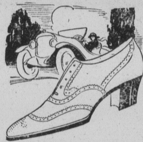
LE PIED SUR LE COFFRE D'EMBRAYAGE

Pour vos constructions vous trouverez chez moi tout ce qu'il vous faut en fait de clous, ferrures, vitres.