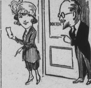
FAITES LE REMPLIR CHEZ VANWART

Le médecin sait sur qui il peut dépendre pour remplir ses prescriptions. Nous, ne faisons usage que des plus pures, plus fraîches et meilleures drogues pour remplir nos prescriptions. Meilleur service: D. H. VANWART LA PHARMACIE REKALL