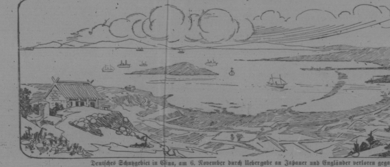
Deutsches Schutzbereich in China, am 6. November durch Uebergabe an Japaner und Engländer verloren gegangen.