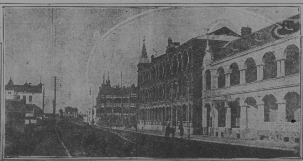
Das obere Bild zeigt die Gebäude der deutschen Militärverwaltung in Kiautschau...