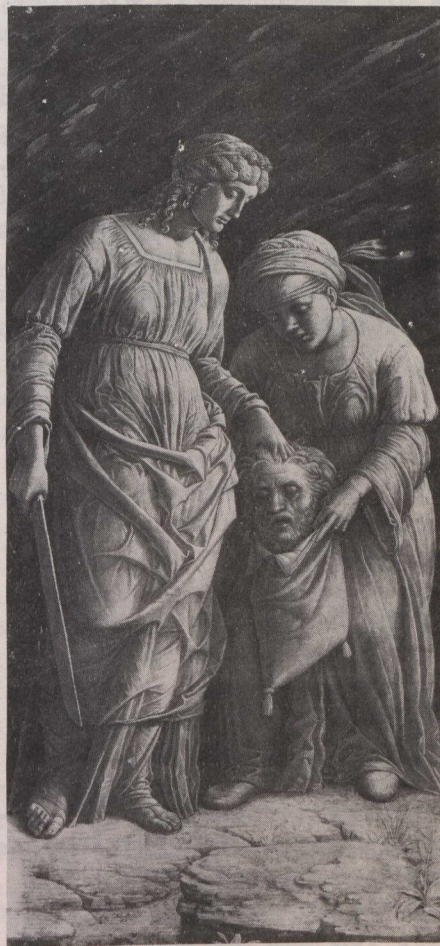
Dido (links) und Judith, 2 Werke des italienischen Malers Andrea Mantegna (1431-1506), die das Montrealer Kunstmuseum zu einer Ausstellung nach Houston (Texas) auslieh.