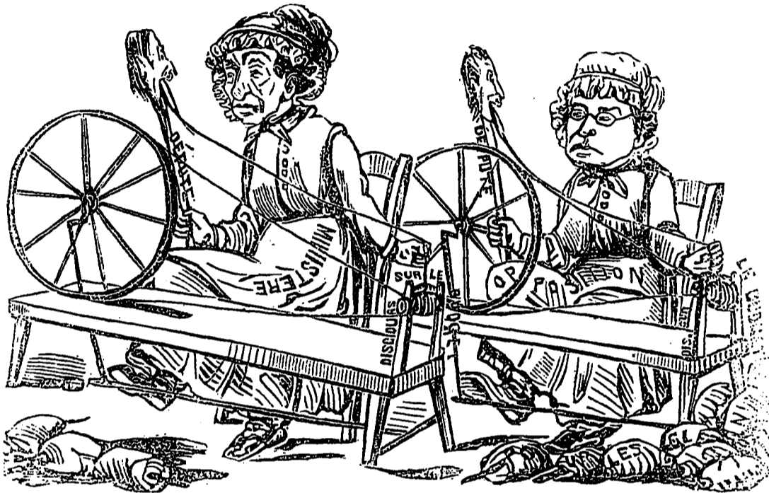
NOTRE INDUSTRIE MANUFACTURIERE. Nos hommes publics filant un mauvais coton.