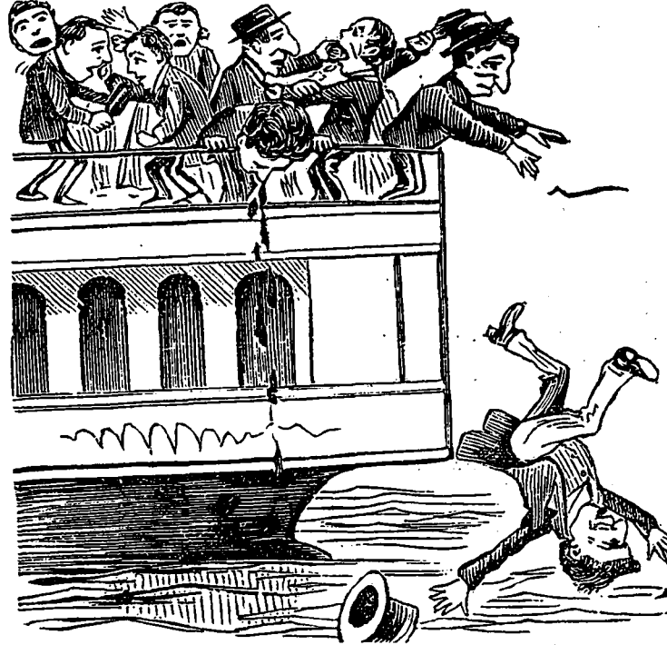
LE VOYAGE DU CANARD (pas le Vrai.)

—Sois sans inquiétude: outre le vœu de pauvreté j'ai fait celui d'obéissance. En suivant non-seu-