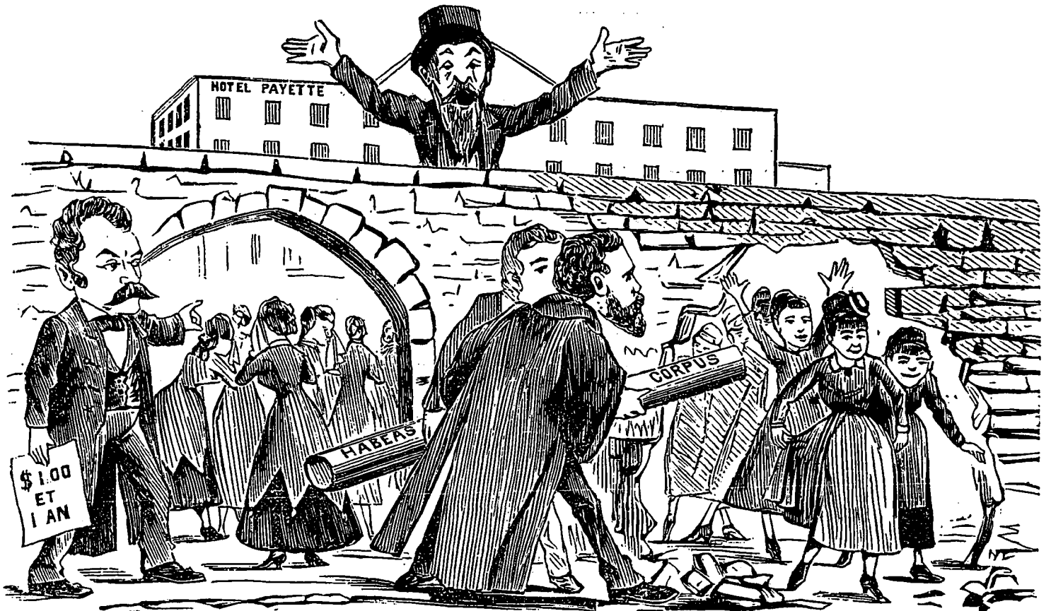
A L'HOTEL PAYETTE.