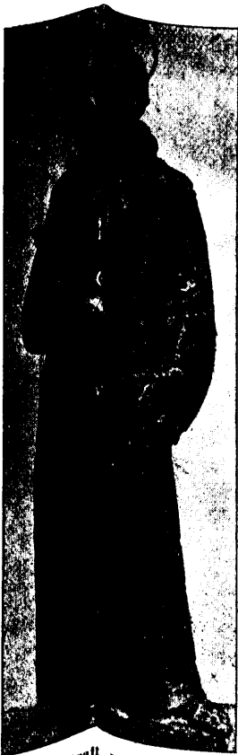
Vrai portrait de S. François pris à sa mort.