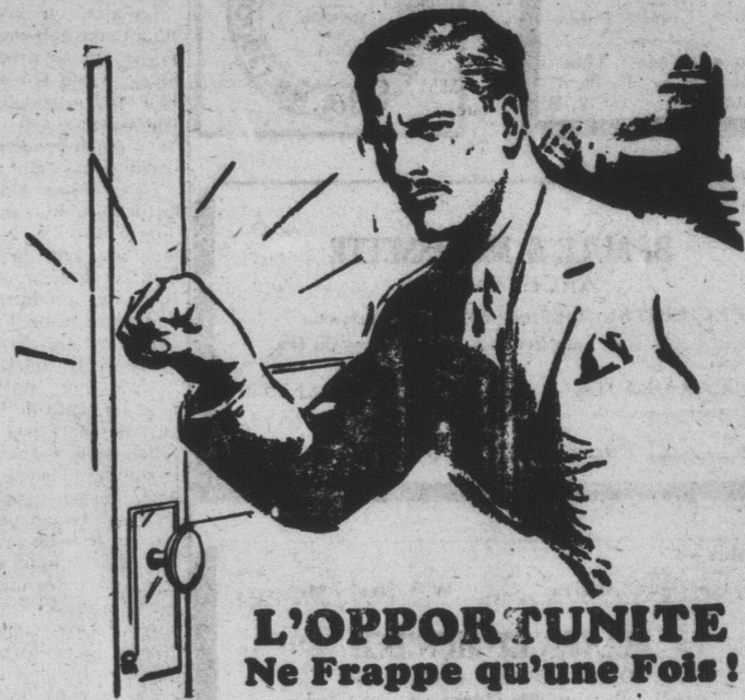
L'OPPORTUNITE Ne Frappe qu'une Foix!

La Presente PERIODE est celle de L'OPPORTUNITE