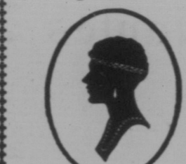
Vermeidet den Weihnachts-trümmel und laßt Euch Bild jetzt anfertigen.

An persönliche Freunde wird ich das persönliche geben: meine Photographie.