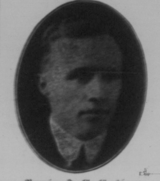
Premier J. G. Gardiner.

Eine lebhaft begrüßte Ankündigung des Premier Gardiner.