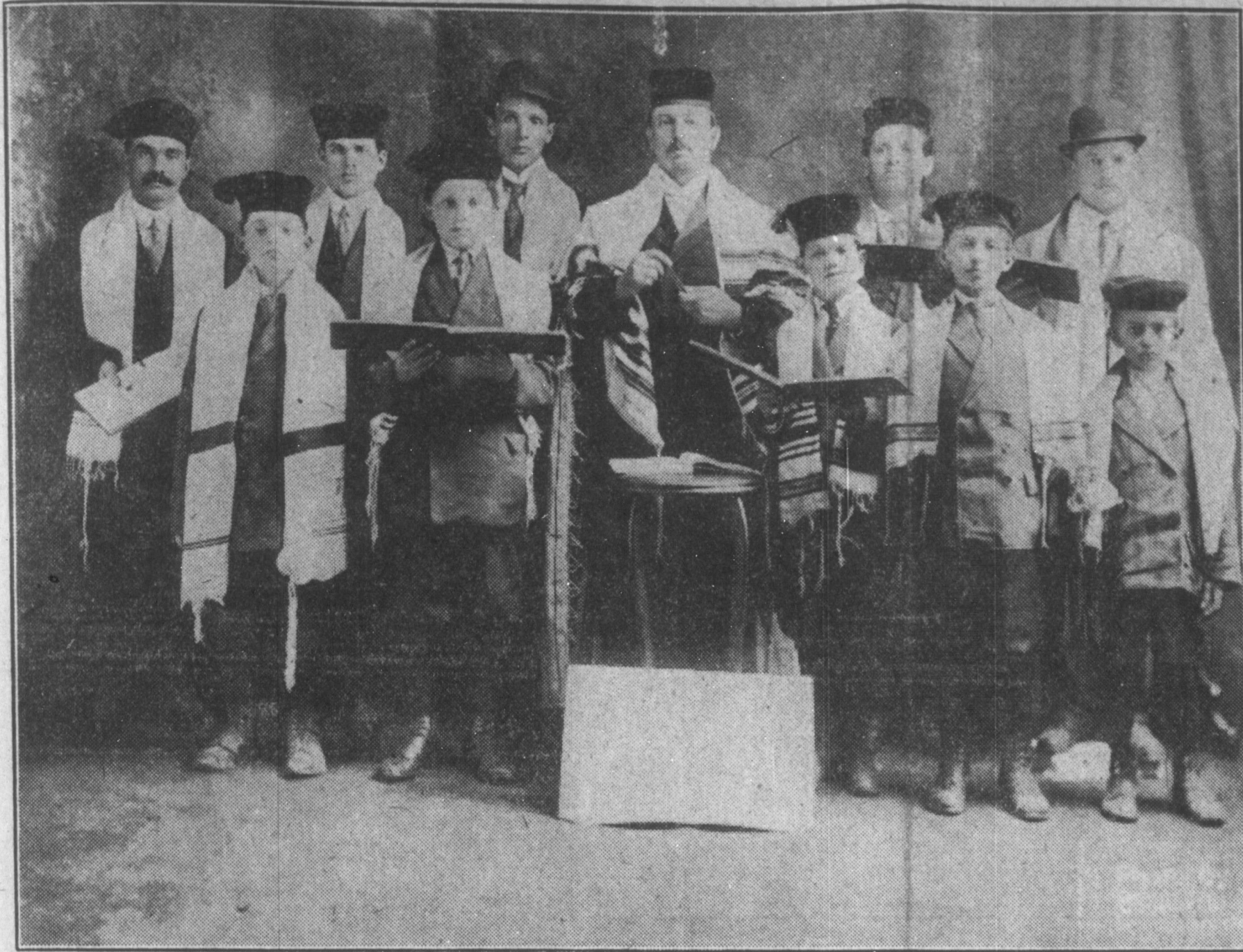
האמא ביי פערשטע טיין און וואלטר.

אויב איהר ווילט הנאה האבען פון יום טוב, אויב איהר ווילט הערען עכט אידישע נגינה, דאן בעזארגט זיך בעצייטענס מיט א טיקעט צו מ. דזשיקאב אין מיניזק'ס האלל, וואו עס ווערט גאר אנטירט פיר רייניקייט, וויבער קייט, גערוימ-קייט און אויך בעסטע ארדנונג. בעל שחרית ר" אברהם יהודה גראס. בעל חוקט ר" בצלאל ראבינסאן. די ערשטע סליחות פריי. טיקעטס שוין צו פאקומען ביי מ. דזשיקאב, 346 פלארא עוועניו. א דאלאר דער בעסטער סיט.