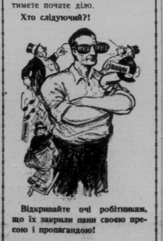
Відкривайте очі робітникам, що їх зарплати панів своєю пресою і пропагандою!

укр. лікар і хірург отворив свою лікарську канцелярію по двох-літній практиці в шпиталі Едмонтону. На листовий запити відповідає по українськи. Адреса: Room 201, Kitchen Block, 10164 A. — 101 Street, EDMONTON, ALTA.