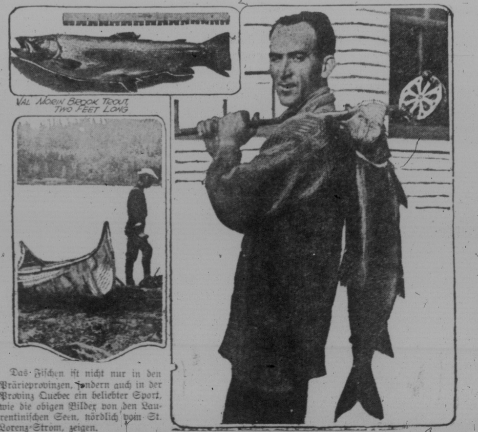
Das Fischen ist nicht nur in den Bräuerprovinzen, sondern auch in der Provinz Quebec ein beliebter Sport...