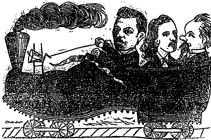
LE RETOUR DE QUEBEC.—Les orateurs reviennent dans le soubresaut de notre populaire échevin.

N'ayez aucune inquiétude pour la clientèle. Il y a au moins six mille personnes sans emploi dans la ville de Montréal. Sur ce nombre vous pouvez être certain de trouver deux mille âmes assez crédules pour vous donner 50 cents avec l'espoir que vous leur donniez du travail.