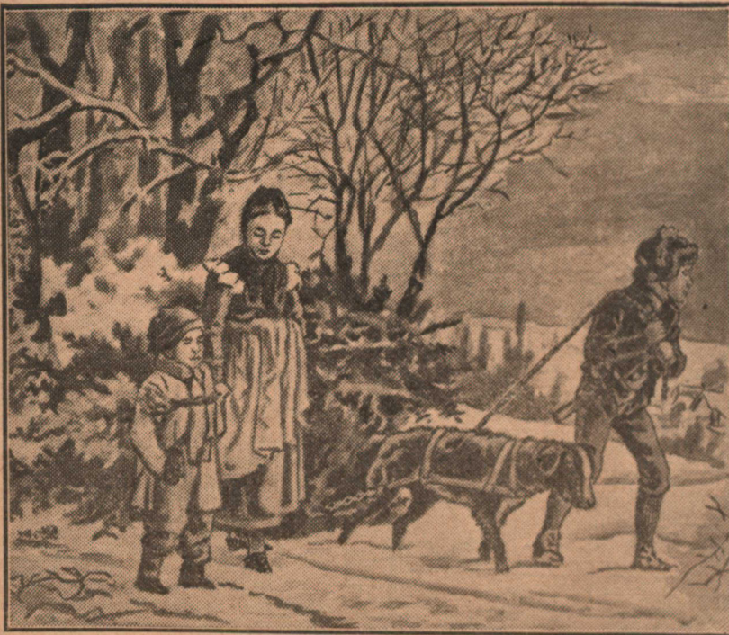
(Gravure gracieusement offerte par la "Presse")

La neige sur le grand chemin, Etend son frais tapis d'hermine, L'air est doux, fluide et serein Ce soir, sur la grande colline.