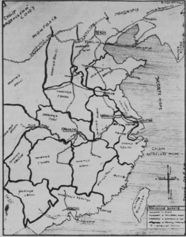
МАПА БІЛЬШОЇ ЧАСТИНИ КИТАЮ.

Китай багатий на плоди. Головні плоди подумного Китаю є рис, бавовна і цукрова тростина, що з неї виробляють цукор. В північному Китаю сльот багато пшениці, а на східних гір росте чай. Китайська культура найстарша. Китайці швидче від Євро-