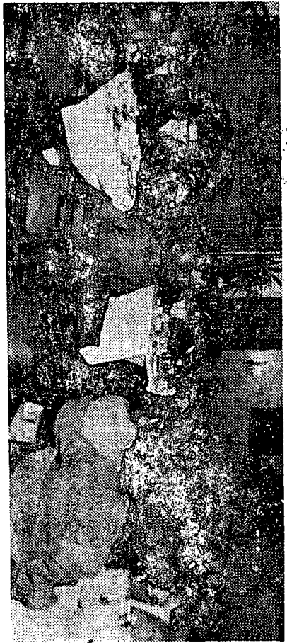
Des délégués de quelque 24 pays francophones membres de l'Agence de Coopération culturelle et technique durant l'allocation de bienvenue prononcée par le maire Drapeau.