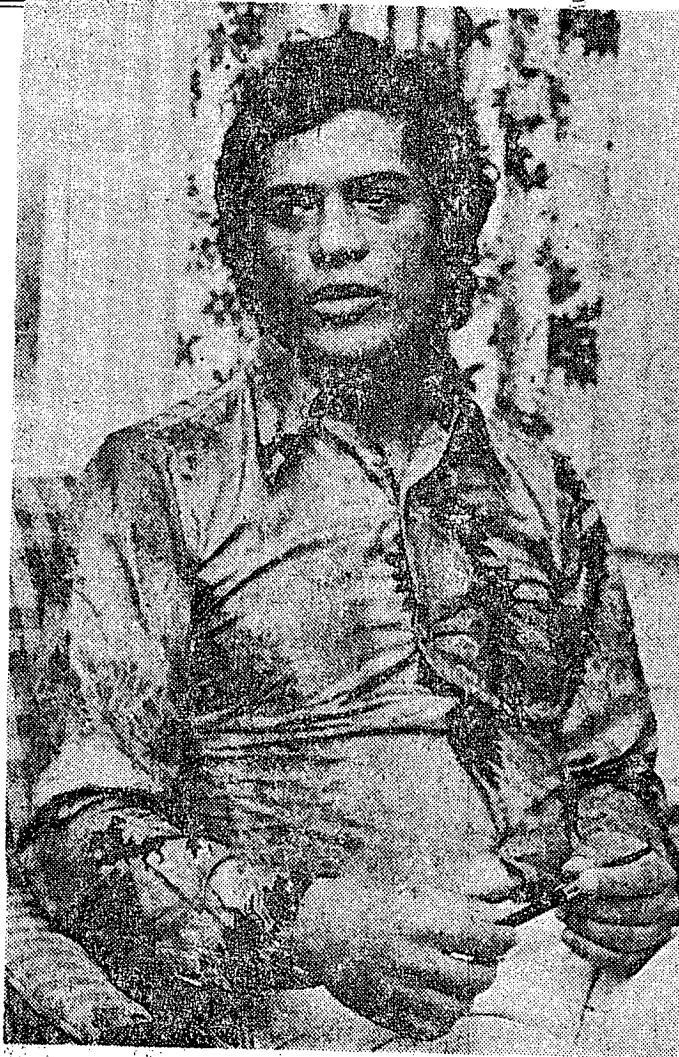
M. Gaétan Duval, ministre des Affaires étrangères de l'île Maurice et maire de Port-Louis, la capitale.