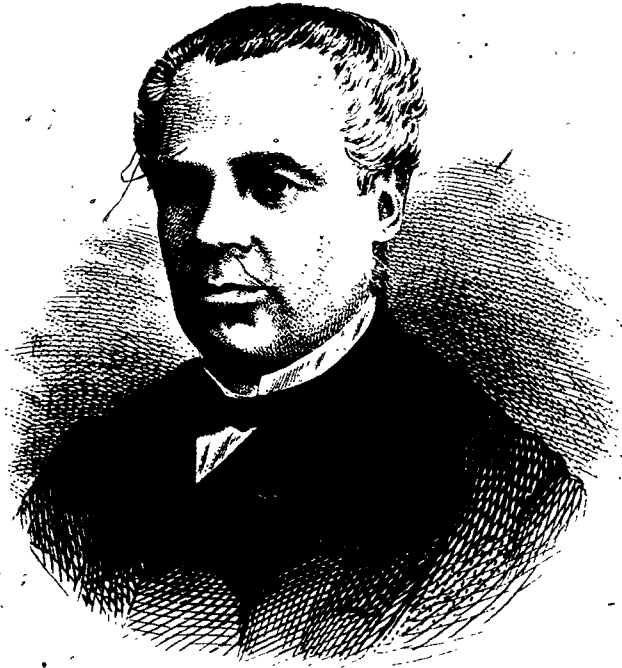
SIR GEORGE-ETIENNE CARTIER.