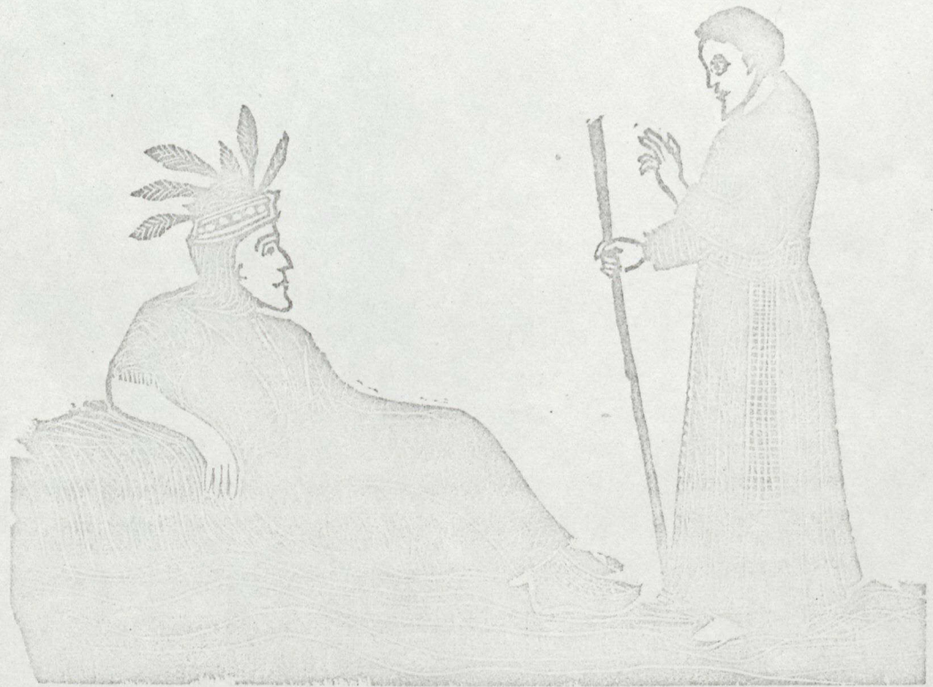
אֲדָמָה אֲדָמָה Dans l'Alberta