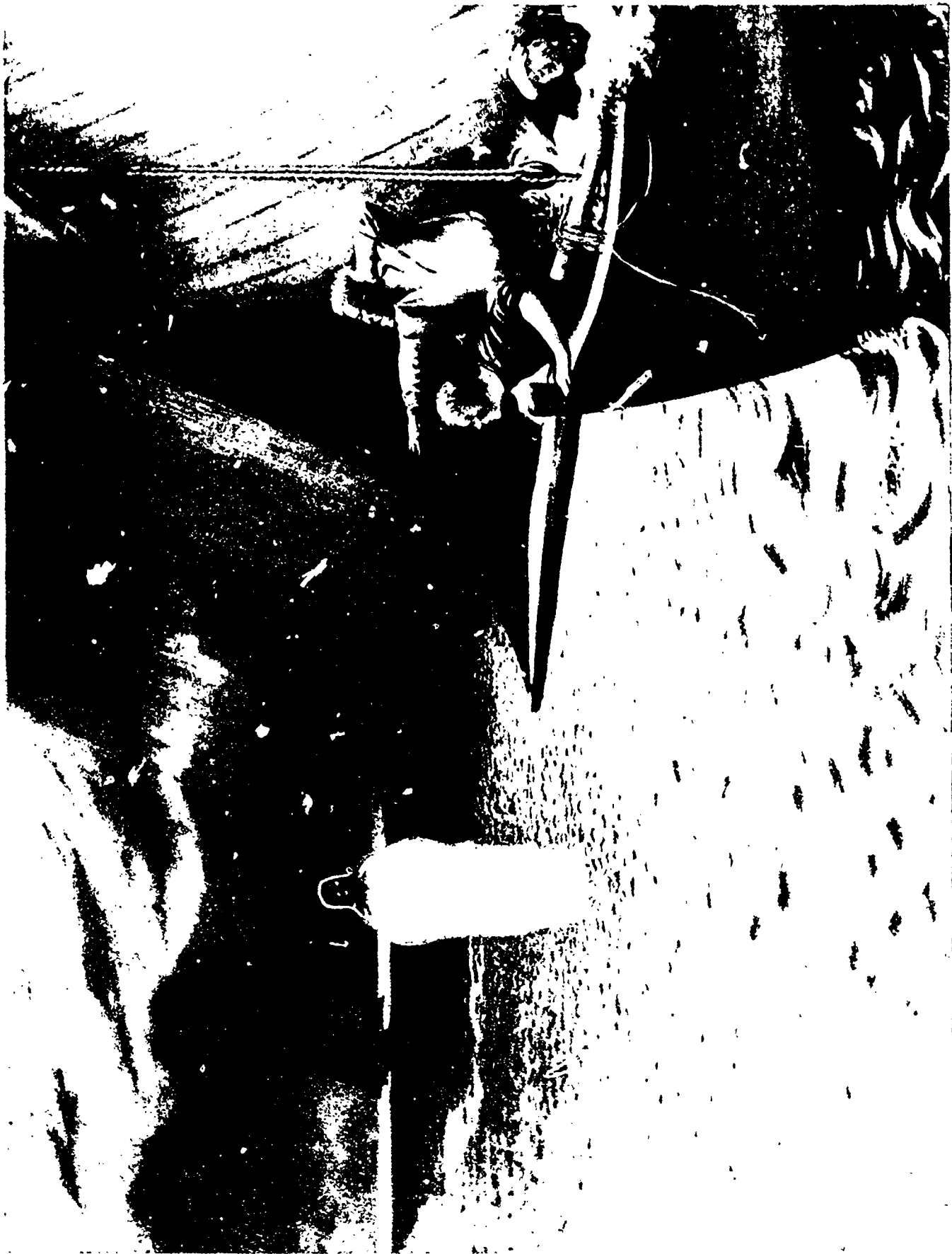
E. DUEZ. — JÉSUS MARCHANT SUR LES EAUX