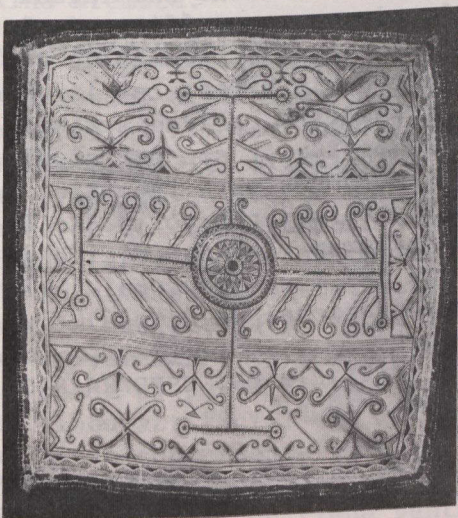
Alfombra de ritual utilizada en ceremonias 'makushan' para propiciar los espíritus del fuego (anterior a 1770).

El material de la colección, datado de 1760 a 1860, procede principalmente