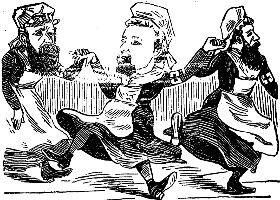
Nos ministres à Québec célèbrent la fin de la Kermesse ministérielle.