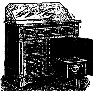
Breveté Janv. 25 1884. Marque de fabrique enregistree

Les Cabinets Universels sont non-seulement indispensables dans la chambre de l'invalido, mais aussi dans toutes les chambres de la maison.