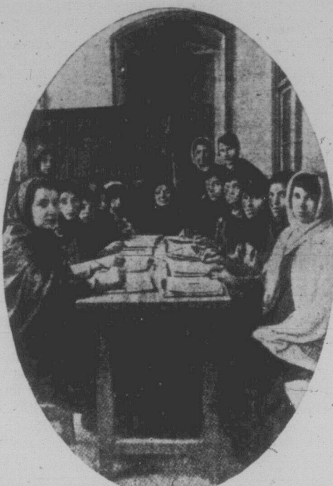
Радянські жінки вчаться політичної грамоти.

бавляли жінок за те, що вони відкривали обличчя й брали участь в революційній діяльності. На початку було лише 20 членкинь в клубі, а до року воно зросло до 100. Культурна праця й лекції проводилися поєднані з організованою групою й з того малого початку нині маємо прекрасну модерну фабрику білого одягу.