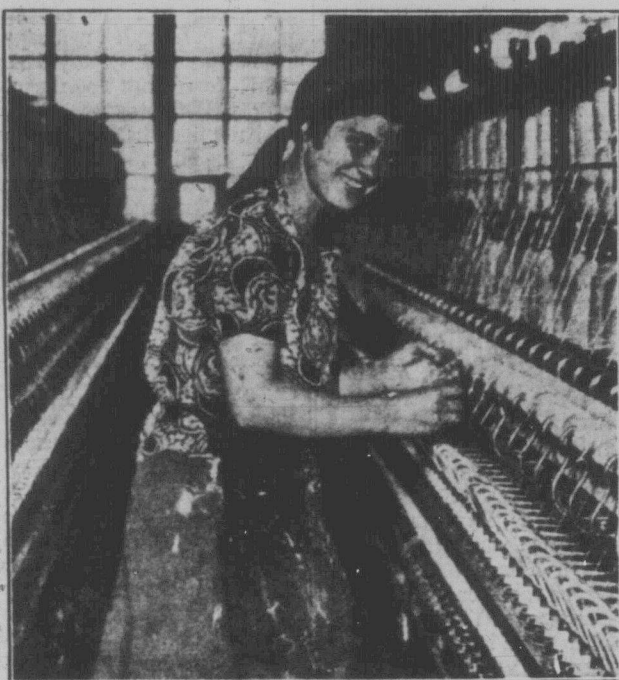
Робітниця текстильної фабрики.

Коли поглянемо на колишнє положення, на бущу темноту й нужду — й нинішнє переродження, то зрозуміємо, як більшовицька революція визволила жінку, й великі досягнення жінки в СРСР є найкращою відповіддю на брехні капіталістів і їхніх допомагачів — соціал-реформістів. Бесі Шатер.