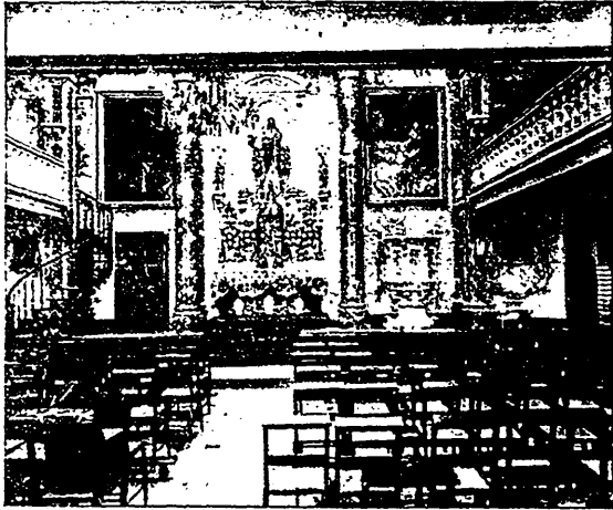
INTÉRIEUR DE LA CHAPELLE