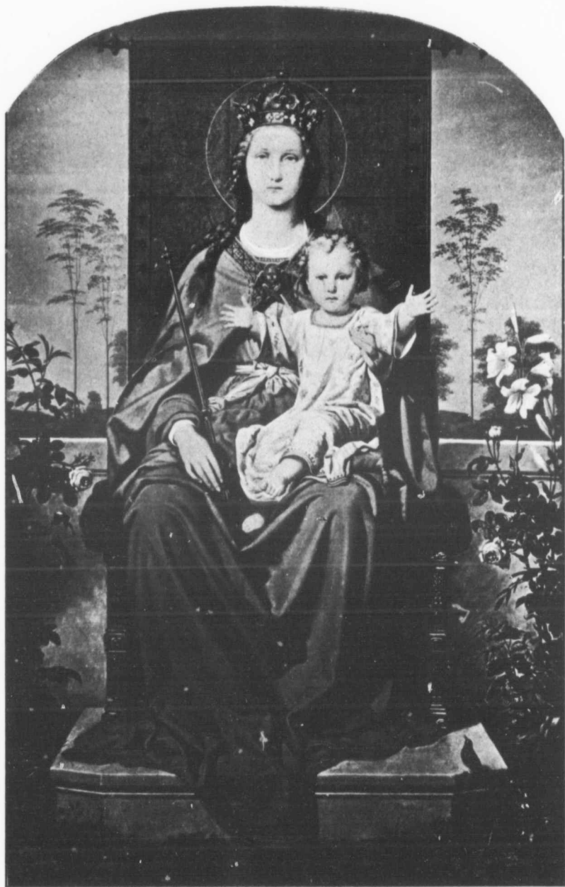
MARIE, REINE DE L'UNIVERS