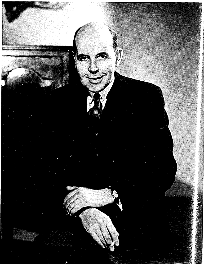
Norman A. Robertson, sous-secrétaire d'État aux Affaires extérieures, 1941-1946