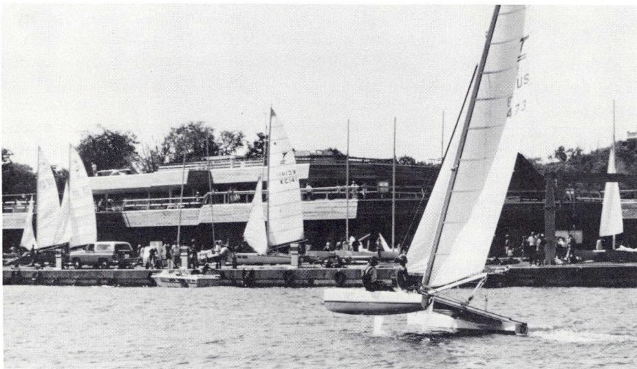
El Centro de Regatas Olímpicas de Kingston, Ontario, situado a unos 300 kms al oeste de Montreal.

Portsmouth Harbour, Kingston, Ontario, emplazamiento de las regatas olímpicas, está situado a unos 300 kms al oeste de Montreal. Kingston, sede de regatas internacionales desde hace cinco años, se encuentra en la costa noroeste del lago Ontario, al comienzo de la Vía Marítima del San Lorenzo.