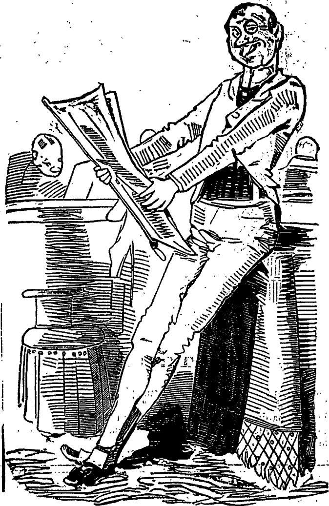
Un lecteur du FARCEUR.

—Non, monsieur, répondit-il, en se rengorgeant; je suis, grâce au ciel, le seul de ma famille dont le prénom ne court pas les rues.