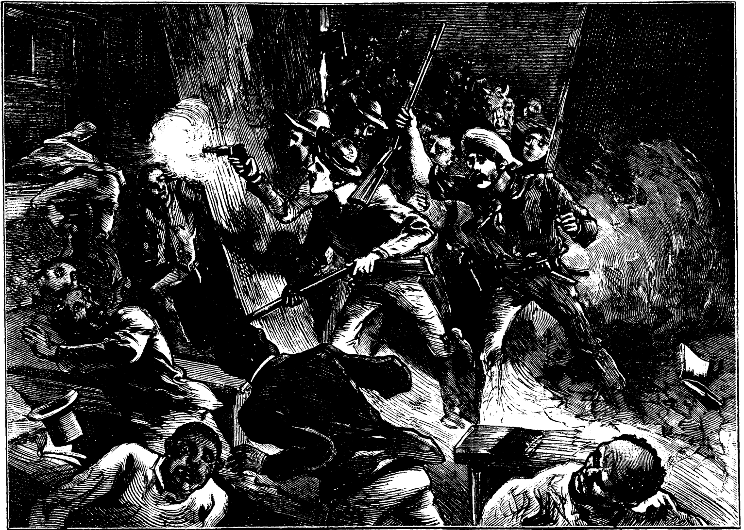
ÉTATS-UNIS.—ATTAQUE D'UNE ÉGLISE PROTESTANTE, A CANE CREEK, PAR UNE BANDE DE BRIGANDS