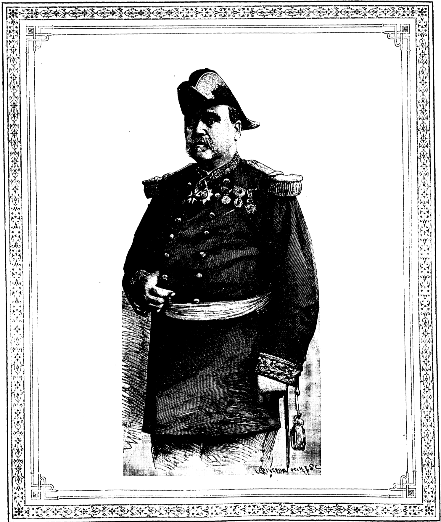
LE GÉNÉRAL BRIÈRE DE L'ISLE

ABONNEMENTS : Six mois : $1.50. — Un an : $5.00