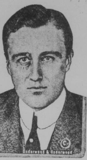
Franklin D. Roosevelt, demokratischer Kandidat für die amerikanische Präsidentschaftswahl.

Chicago, 2. Juli. — Gouverneur Franklin Roosevelt von New York wurde gestern Abend zum Vorkandidaten der demokratischen Partei bei der bevorstehenden Präsidentschaftswahl ernannt. Seine Nominierung erfolgte dank der Unterstützung der Delegierten aus Kalifornien und Texas, die vorher für Garner gestimmt hatten. Garner hatte ihnen jedoch die weitere Einstellung freigegeben, worauf sie einstimmig für Roosevelt stimmten, jedoch der Gouverneur bei der vierten und letzten Abstimmung zuletzt 945 der 1.148 Stimmen auf sich vereinte. Heute muß die Nominierung noch den demokratischen Kandidaten für die Vizepräsidentschaft aufstellen. Man erwartet nicht, daß die Nominierung auf Sprecher Garner entfällt. Roosevelt entschloß sich dazu, nach Chicago zu fliegen, um dort vor der Nominierung seinen Dank für die Nominierung auszusprechen und in gewisser Weise auch mit inspirierenden Worten den Präsidentschaftswahlkampf zu eröffnen. Der Wahlkampf wird auf dem