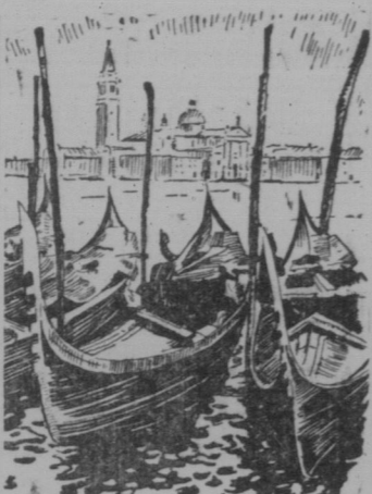
Venedig Gondeln an der Piazzetta