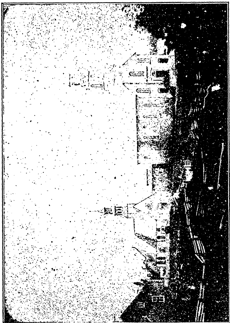
Eglises de Saint-Laurent