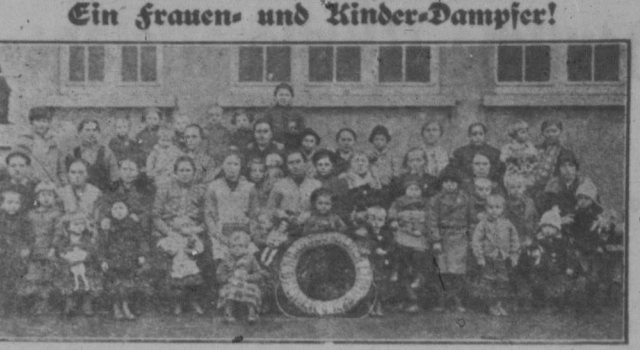
Ein Frauen- und Kinder-Dampfer! In der vorletzten Woche trafen die 114 Passagiere des Norddeutschen Lloyd-Dampfers „Stuttgart“ im westlichen Canada ein.