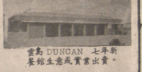
雲島 DUNCAN 七年新 餐館生意或實業出賣

四年翻新,三房一廳,約千八尺 土庫完成兩單位,49'5X122 每逢星期日下午三至五時開放 2260 E.10街.